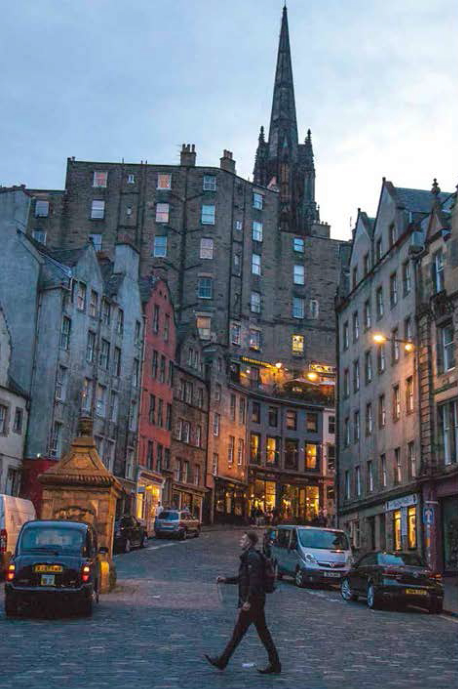
Arriba: la calle Victoria es referente en Edimburgo por sus pubs. Pag. Op.: el tour Mary King's Close contrapone historias de la realeza con las de gente común.