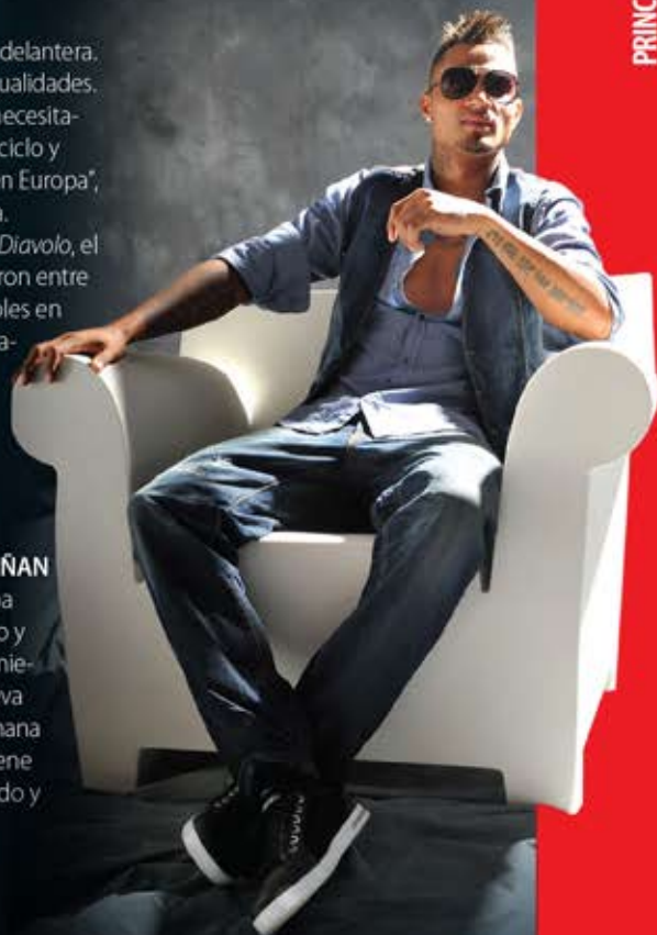
EL PRÍNCIPE PRINCE BOATENG

Boateng tiene una estampa ruda. Su peinado de raperero y sus 36 tatuajes provocan miedo. En el brazo derecho lleva escrita la palabra Berlín, Ghana en el izquierdo. Además tiene "dos bufones: uno sonriendo y