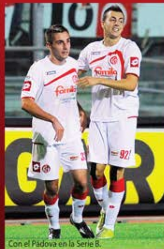
Con el Pádoва en la Serie B.

En ese primer choque, tomó el balón sobre la banda izquierda, se enfloó al centro, se apoyó en un compañero que le regresó la pared hacia el centro del área. El Shaarawy recibió el balón al borde del área chica y remató... pero el tiro salió directo al portero. El novel delantero se lamentó llevándose las manos a la cabeza pues sabía que había perdido una clara oportunidad.