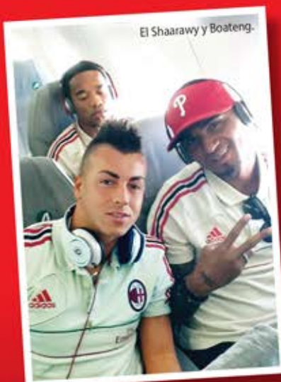
El Shaarawy y Boateng.

y le despertó un sentido altruista; Il Piccolo Faraone viajó a Savona, su ciudad natal, para visitar al equipo que le vio surgir cuando era un niño y tener un gesto humanitario. "La iniciativa de donar un desfibrilador al Legino 1910 la hago con el Milán. Es una ayuda al deporte amateur al que me siento muy apegado, porque este equipo vio comenzar mi aventura. Es una herramienta que puede salvar vidas y evitar accidentes como el de Morosini", dijo El Shaarawy quien asegura ser un tipo tímido, aun cuando ha participado en sesiones fotográficas para prestigiosas marcas de ropa como Dolce & Gabbana.