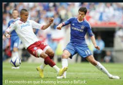
El momento en que Boateng lesionó a Ballack.

Kevin Prince no pudo levantar aquella Copa, pero ese día en Wembley no se achicó ante Michael Ballack y dejó ver el carácter que forjó en Berlín desde sus primeros años de vida, por el cual se le conoce como Ghetto Kid : "Me llaman así porque vengo de un barrio considerado por los alemanes como un gueto (Wedding), no es como las favelas brasileñas pero es un lugar muy difícil. Había mucho crimen y traficantes de drogas; una vez vi cómo le dispararon a alguien enfrente de mí", recuerda.