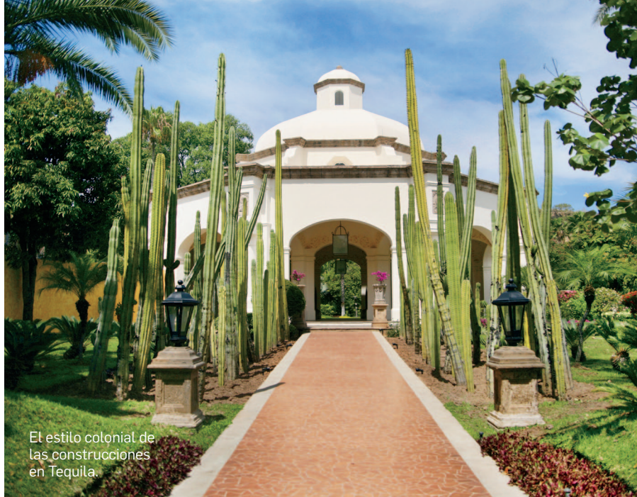
El estilo colonial de las construcciones en Tequila.

NO SE SABE EXACTAMENTE qué fue primero: el vino mezcal –como le llamaban al tequila cuando empezaron a producirlo– o los relatos... pero están íntimamente ligados. En Tequila, el aguardiente y la tradición han generado leyendas que le dan otro color a las fachadas del pueblo mágico. Nadie sabe qué fue real, pero el lugar se rige por la bebida y el folclore de sus efectos. El mismo origen del tequila es, en sí, una leyenda que cuenta cómo un grupo de indígenas mexicas caminaba en el campo entre magueyes cuando una tormenta los sorprendió. Se refugiaron en una cueva mientras pasaba la lluvia, y un rayo azotó una de las plantas, cocciéndola. Esto hizo que la planta comenzara a desprender un olor inigualable que los atrajo, y descubrieron su miel... y lo demás es historia.