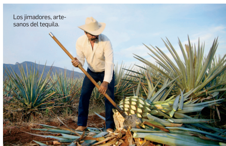
Los jimadores, artesanos del tequila.