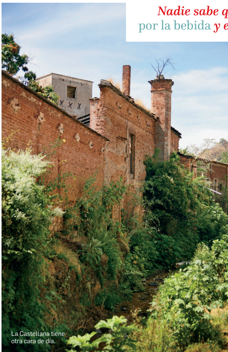
La Castellana tiene otra cara de día.

Nadie sabe qué fue real, PERO EL LUGAR SE RIGE por la bebida y el folclore de sus efectos.