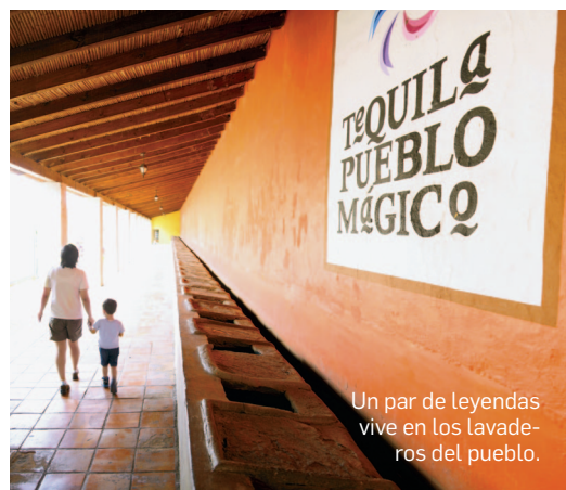
Un par de leyendas vive en los lavaderos del pueblo.