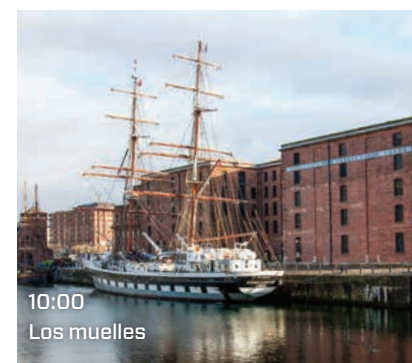
10:00 Los muelles