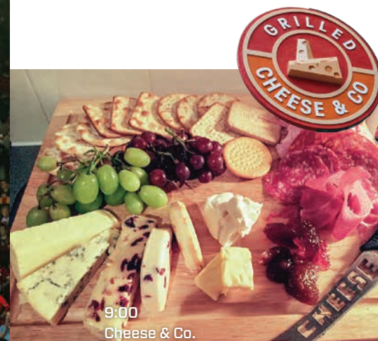
9:00 Cheese & Co.